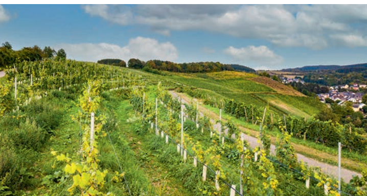
Die Querterrassen bieten Lebensräume für Wildkräuter und Tiere.

Einen Beitrag zum Erhalt der Biodiversität in der lokalen Pflanzen- und Tierwelt leisten Streuobstwiesen, Blühstreifen und Feldhecken.